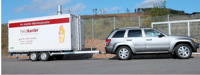
Stets einsatzbereit: die mobilen Heizzentralen von heizkurier.

Pelletanlage mit zwei Monaten sehr lang. Das Verwaltungsgebäude mit 170 Mitarbeitern musste über Winter beheizt werden. Somit war klar, dass externe Wärme zwingend benötigt wurde.