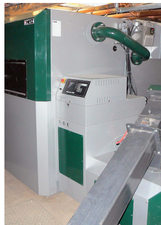
In diesem Objekt wurde eine Pelletheizung des österreichischen Herstellers, der Fa. Herz, installiert.