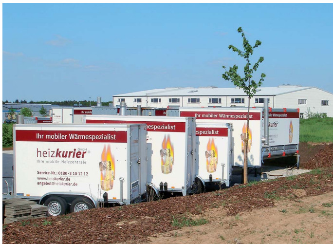
Für jeden Anwendungsfall die geeignete mobile Heizzentrale.

Ein Ingenieurbüro wurde mit der Konzipierung einer modernen Holz-Pelletanlage beauftragt. Doch mittlerweile war es November und die Lieferzeit der